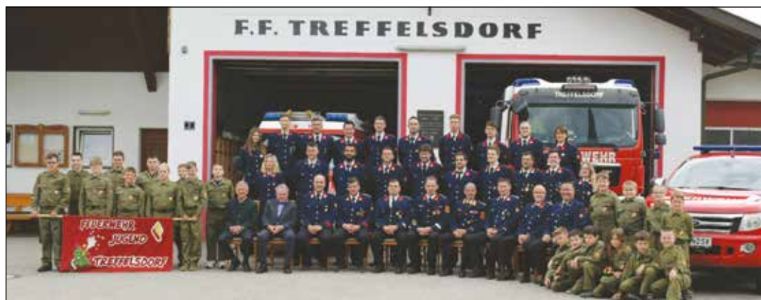
Die Kameradinnen und Kameraden der FF Treffelsdorf gemeinsam mit der Jungfeuerwehr.

Auch unsere Feuerwehrjugend war erfolgreich. So nahm unser Nachwuchs neben 29 Jugendübungen beim Wissensspiel & Wissenstest in Grades dabei und alle