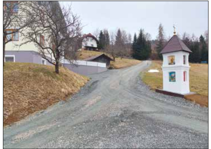
Entgegen unseren Erwartungen können wir voraussichtlich die Stammerdorfer Straße heuer asphaltieren.

Wir bedanken uns bei der Bevölkerung für das aufgebrachte Verständnis und hoffen, dass sich heuer so ein Ereignis nicht wiederholt. Wir wünschen weiterhin eine gute Fahrt auf den Straßen der Gemeinde Frauenstein und auch darüber hinaus.