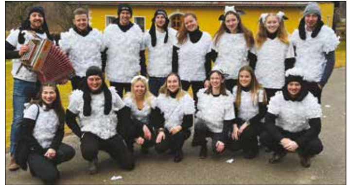
Die Landjugend als "Herde weißer Schafe" beim Faschingsumzug durch Frauenstein.