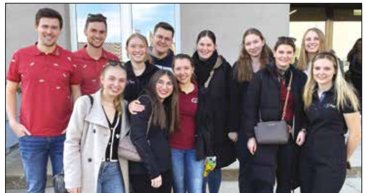
Auch beim Bezirksfunktionärskurs waren wir vertreten.