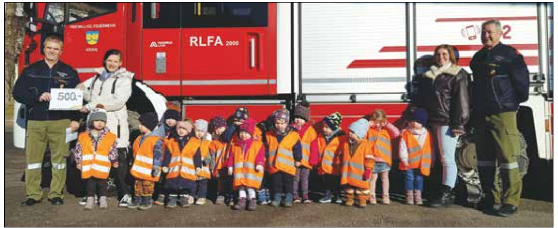
Die Kinder unserer Tagesstätte Springinkerl spendeten unserer Feuerwehr 500 Euro aus dem Erlös ihres Basars vom Laternenfest. Ein herzliches Danke dafür.

Um erlernte Fähigkeiten zu intensivieren, nahmen im vergangenen Jahr einige Kameraden an diversen Leistungsprüfungen teil. So konnte das Kommando 6 Kameraden zur erfolgreich absolvierten Technischen Leistungsprüfung in Silber, drei Kameraden zum erfolgreich absolvierten Atemschutzleistungsabzeichen in Silber und