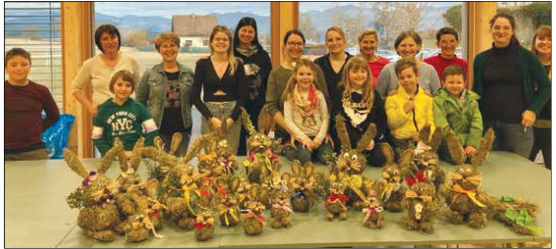
Ausgebucht war der Heuhasen-Bastelkurs der Schatztruhe Wimitzerberge.

Am Ende war die Freude bei den Teilnehmern über die entstandenen Heuhasen sehr