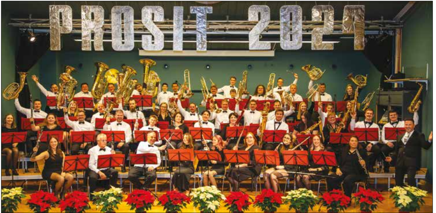
Das traditionelle Neujahrskonzert der Glantaler Blasmusik Frauenstein wurde heuer vom Doppelsextett Carinthia mitgestaltet und begeisterte mit ausschließlich von Kärntner Komponisten gespielten Stücken das Publikum.