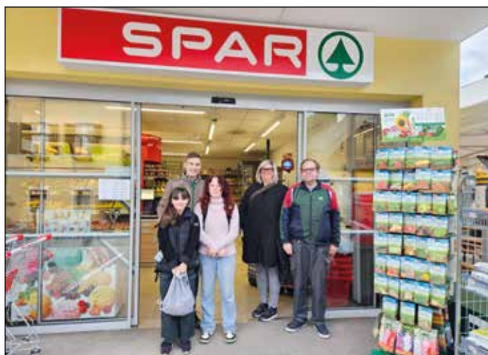
Die ersten Kunden waren bereits um 7 Uhr bei unserem neuen Spar-Supermarkt und freuten sich über das reichhaltige Angebot vor Ort.

Bürger "Lokalpatriotismus" zu zeigen und unseren neuen Nahversorger zahlreich in Anspruch zu nehmen.