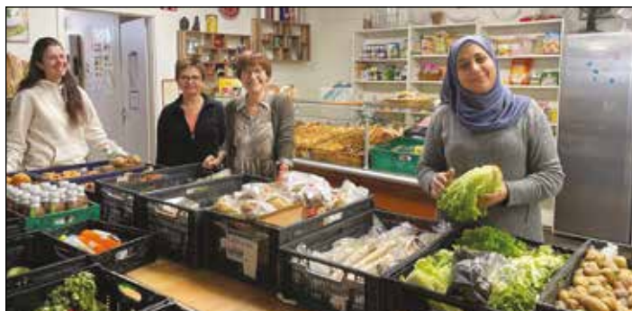
Im Together-Point in St. Veit ist jeder herzlich willkommen. Neben geretteten Lebensmitteln findet man dort eine große Auswahl an Second-Hand Kleidung, alles fürs Kind, Bücher, Spiele, Deko, Geschirr, Gläser uvm. - für jede/n ist was dabei!