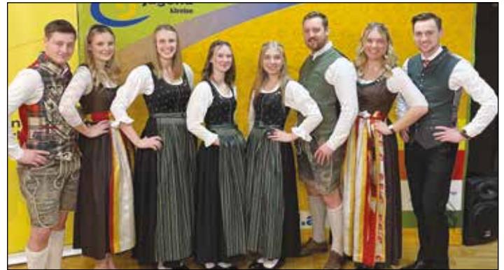
Die Tanzkenntnisse wurden bei der Volkstanzwoche in der LFS Ehrental aufgefrischt.