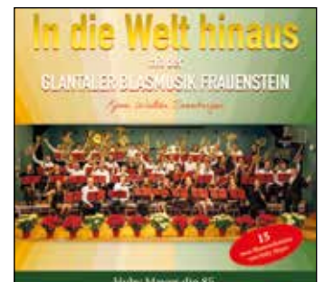
Erhältlich bei den MusikerInnen und am Gemeindeamt Frauenstein.