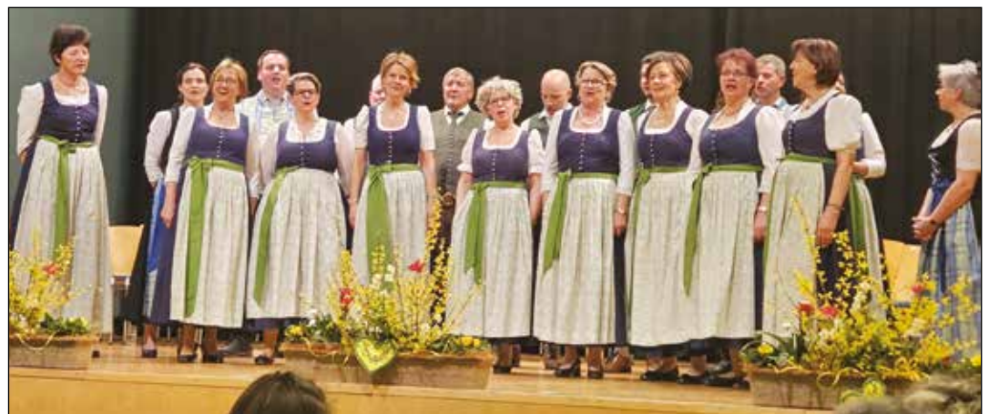
Der Singkreis Frauenstein, der Kraiger Viergesang und das Trio AGB stellten sich in den Dienst der guten Sachen und unterstützten mit ihrem Konzert die AVS-Tagesstätte in Kraig.