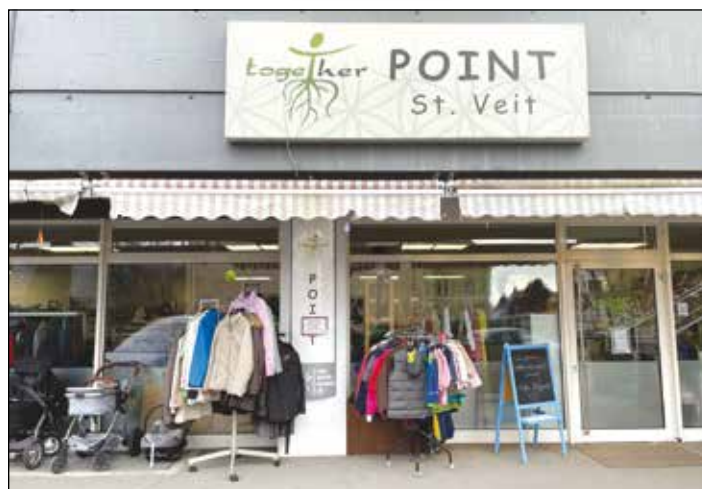
Der Together-Point in St. Veit befindet sich am Platz am Graben 2 und ist Di - Fr von 9 - 13 Uhr, Sa von 9 - 12 Uhr und So von 9 - 11 Uhr geöffnet.

Wer diesen Artikel ausschneidet und mit in einen Together Point bringt, bekommt ein kleines Geschenk!